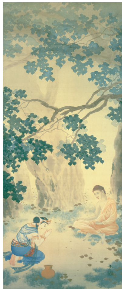
菱田春草《乳糜供養》1903年頃 長野県立美術館所蔵