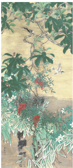
池上秀畝《四季花鳥》1918年 長野県立美術館所蔵